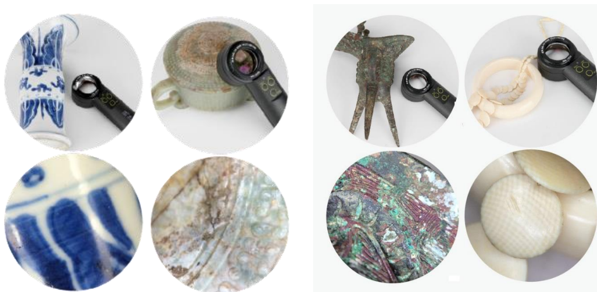
Фарфор, нефрит, бронза, слоновая кость