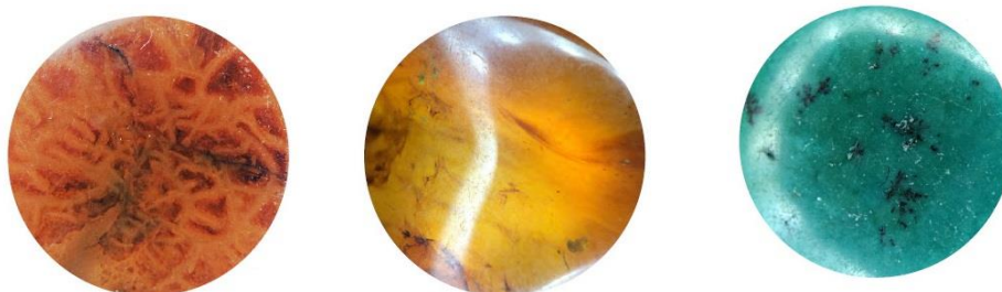
Красный агат, янтарь, бирюза